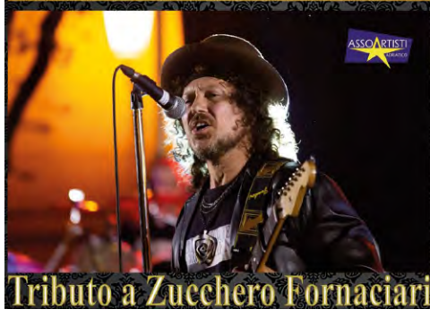
Tributo a Zucchero Fornaciari